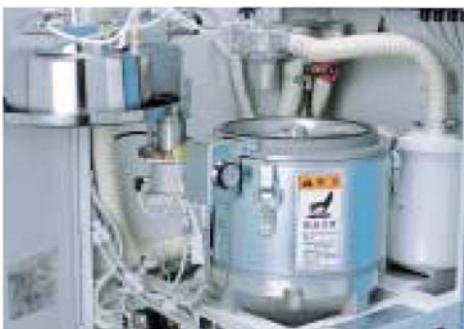
昇降リフト Hoisting lift