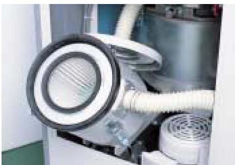
フィルタボックス Filter box