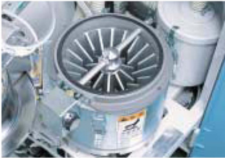
ホッパ内部 Hopper Inside